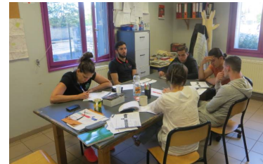
La place des jeunes dans la société