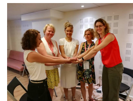
La lutte contre l'isolement des personnes âgées et des familles monoparentales

Compétence Bénévolat Conseil - Formation auprès des associations et collectivités locales www.c-benevolat.fr