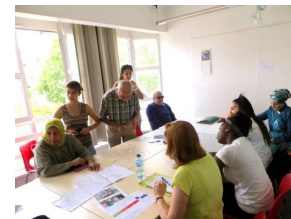
Le rôle des collectivités locales dans l'encouragement des initiatives citoyennes